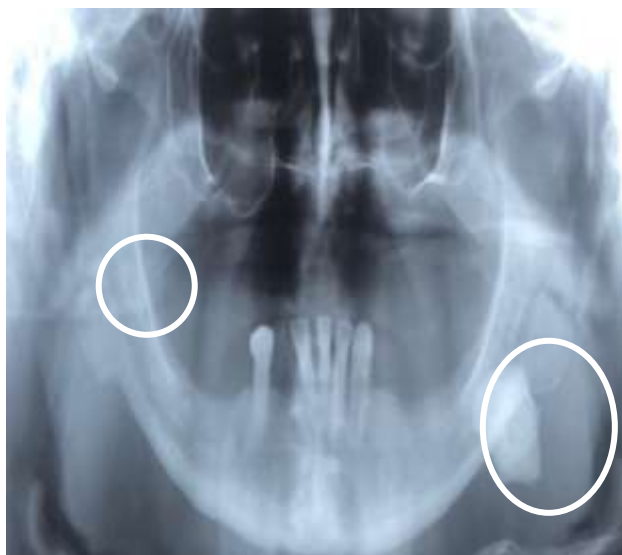
Figura 03. Radiografia panorâmica evidenciando a presença de sialolito gigante à esquerda e múltiplos sialolitos de menores dimensões à direita.