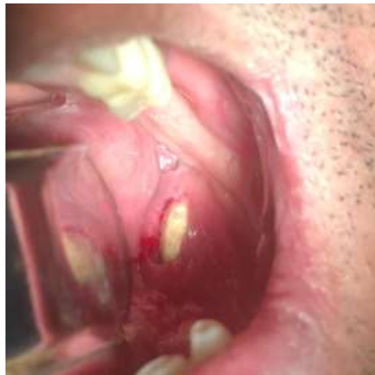
Figura 02. Sialolito gigante de coloração amarelada erodindo mucosa de assoalho bucal.