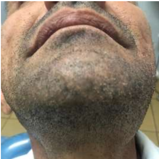
Figura 01. Assimetria em terço inferior de face à esquerda.