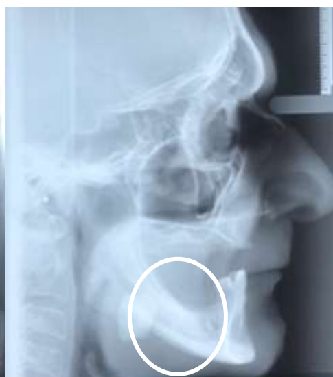
Figura 04. Telerradiografia lateral de face evidenciando a presença de sialolito gigante.

Como conduta clínica optou-se por remoção cirúrgica com acesso intraoral e anestesia local com reconstrução do ducto da glândula submandibular. O paciente foi submetido ao procedimento em 15/08/2019, sendo realizada anestesia local pterigomandibular e infiltrativa. Como o sialolito se encontrava erodindo mucosa de assoalho bucal e, portanto, visível foi utilizado bisturi com lâmina 15 para realização de incisão de alívio e de pinça hemostática para a divulsão dos tecidos circunjacentes e retirada do sialolito, que foi removido em sua totalidade (Figura 05). A loja cirúrgica foi