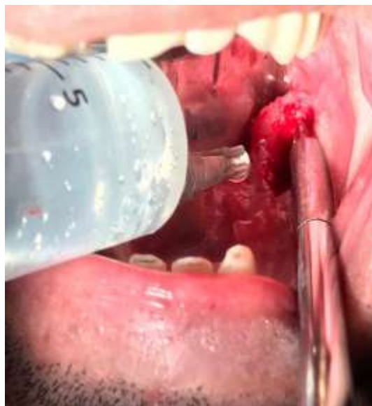
Figura 06. Loja cirúrgica irrigada abundantemente com soro fisiológico 0.9%.