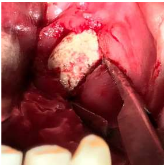
Figura 05. Divulsão dos tecidos circunjacentes com pinça hemostática.

abundantemente irrigada com soro fisiológico a 0,9% (Figura 06) e a sutura foi feita com fio de nylon 4-0 (Figura 07 e 08).