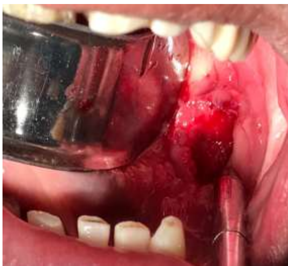
Figura 07. Loja cirúrgica após remoção do sialólito gigante e de abundante irrigação.