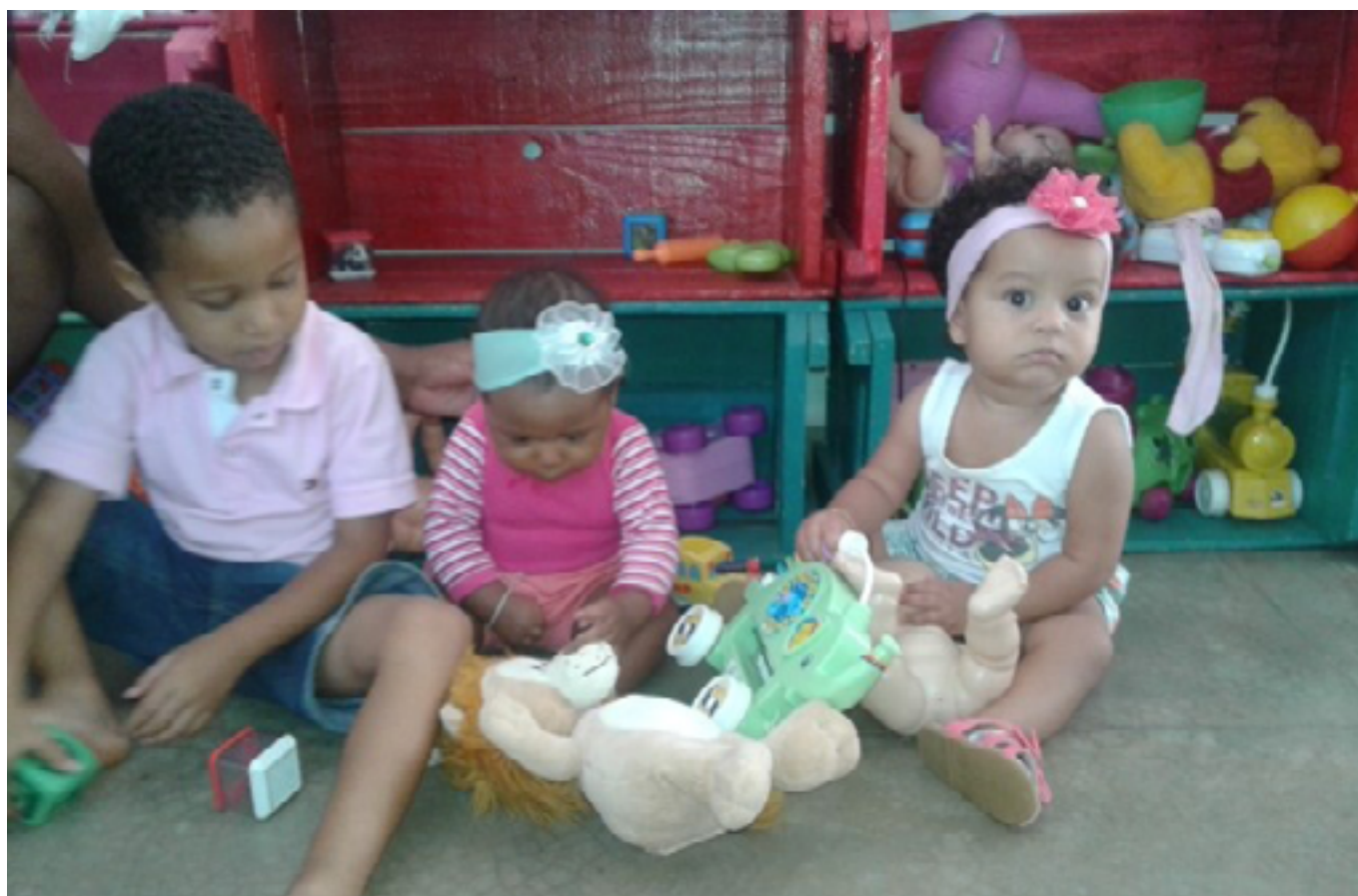
Foto 2. Crianças na ciranda 10

Algumas crianças chegam com algumas dificuldades, e com a vivência, relações e atividades, desenvolvem habilidades, aprendendo a conviver em coletivo.