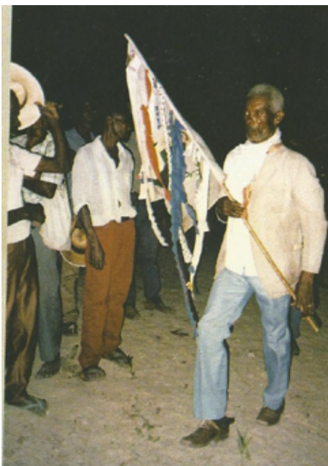
Excerto 4: Cantiga de folia

Oh menina o que você tem? Maribondo, sinhá, maribondo sinhá. É hoje, é hoje que a paia da cana voa É hoje que, É hoje que ela tem de avoar. Rainha de ouro, de ouro só Esse rei é de ouro, de ouro só Osála de vadiá varanda Osála de vadiá varanda.