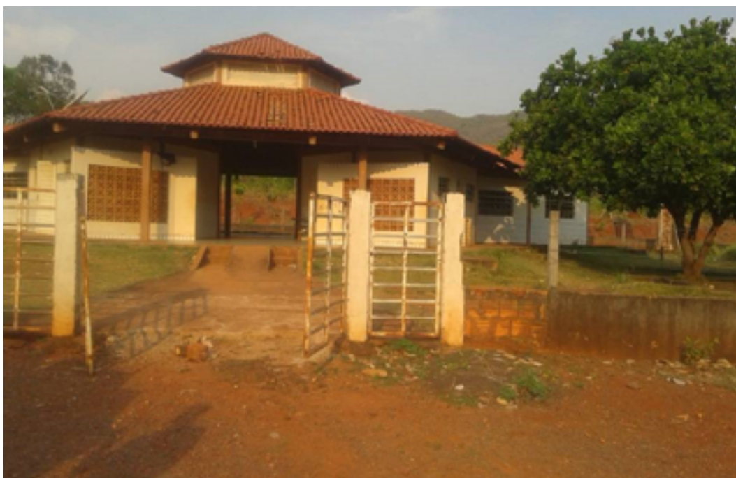
Foto 1. Escola Municipal Tinguizal Extensão Kalunga II.

As crianças têm acesso a uma escola muito boa e bem estruturada. Antigamente as crianças só trabalhavam e não tinham acesso á escola. Observa-se que a maioria dos mais velhos que moram na comunidade, são analfabetos devido ao acesso que não tinham. As vezes não tinham o que comer, saiam na mata a procura do que levar para casa para comer. Era tudo muito triste. Mas hoje a situação ainda anda precária, porém está melhor, devido ao acesso à educação e à saúde, o que é bastante gratificante.